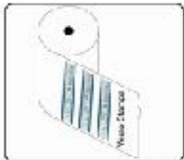
A) Formato adesivo 80 x 17 mm

i contrassegni adesivi vengono forniti dal Poligrafico secondo il senso di svolgimento riportato nelle immagini sottostanti.